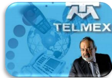
Carlos Slim y TELMEX

❖ Desarrolla las asociaciones formales o informales con proveedores de productos tecnológicamente diferenciados, con clientes globales y competidores internacionales. Sus objetivos son la mejora de eficiencia operativa, actualización tecnológica, aumento de las ventas de mercado local a través de complementación de la línea de productos o expansión de las ventas internacionales.